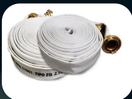
MANGUEIRAS DE HIDRANTE PREDIAL - INDUSTRIAL