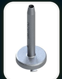
ESGUICHO JATO SÓLIDO