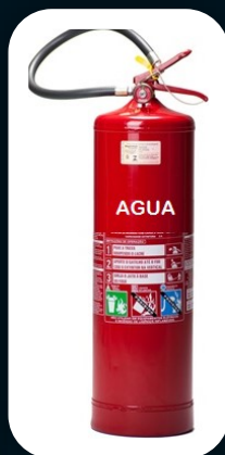
AGUA 10 E 75 LITROS