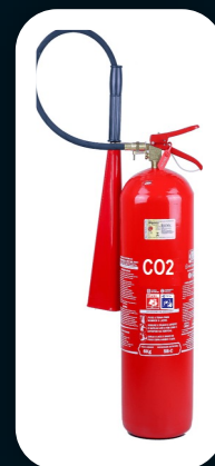
CO2 4, 6, 10, 25 KG