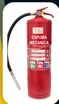
ESPUMA MECÂNICA 10 E 50 LTS