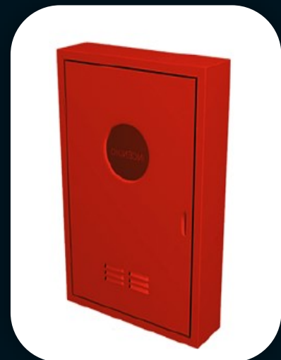
ABRIGO PARA MANGUEIRAS DE INCÊNDIO SOBREPOR e EMBUTIR 75x45x17 e 90x60x17