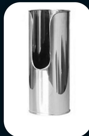
SUORTE DE SOLO MODELO BATOM