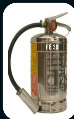
CLASSE FE 36 2,5 e 5 KG