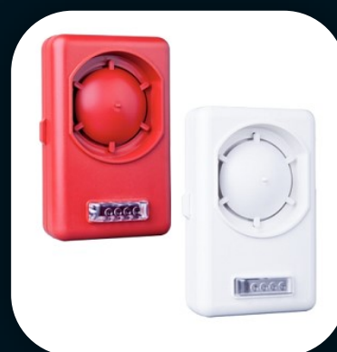
SIRENE DE ALARME DE INCÊNDIO AUDIO VISUAL