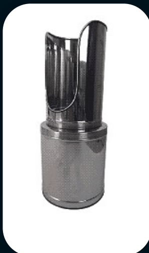
SUORTE DE SOLO MODELO TORRE