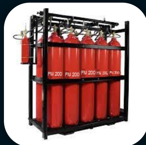
SISTEMA FIXO DE SUPRESSÃO