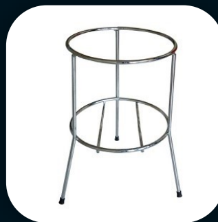
SUORTE DE SOLO MODELO TRIPE