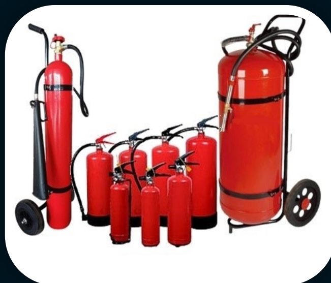
EXTINTORES PORTÁTEIS E SOBRE RODAS AGENTES: ÁGUA, PQS BC E ABC, CO 2 , ESPUMA MECÂNICA CLASSE D, CLASSE K, FE 36, FM 200