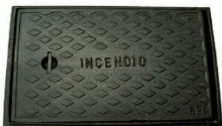
TAMPA DE FERRO FUNDIDO 60 x 40 cm Pedestre Carros de Passeio Caminhões