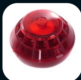
SIRENE DE ALARME DE INCÊNDIO