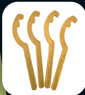
CHAVE STORZ DUPLA