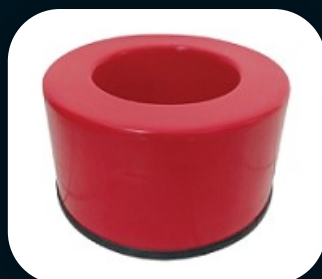
SUORTE DE SOLO MODELO CIRCULAR