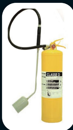
CLASSE D 9 E 50 KG