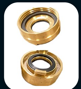
ADAPTADOR STORZ PARA MANGUEIRA DE INCÊNDIO 1 1/2 e 2 1/2 - Latão