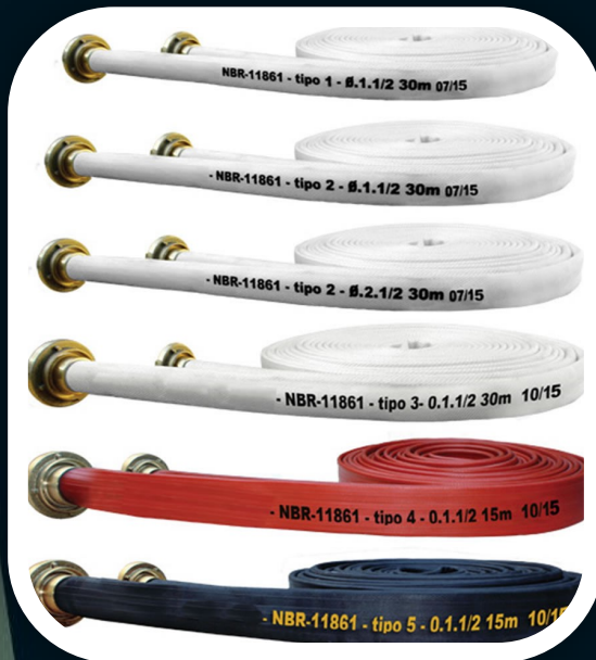
MANGUEIRAS DE HIDRANTE PREDIAL e INDUSTRIAL