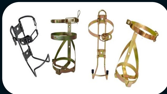
SUORTE PARA EXTINTORES AUTOMOTIVOS Carro de Passeio Caminhão, Ônibus, Van