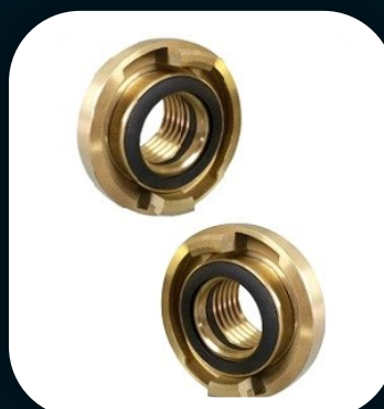
UNIÃO PARA MANGUEIRA DE INCÊNDIO Predial e Industrial de 1 1/2 e 2 1/2