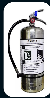
CLASSE K 6 LITROS