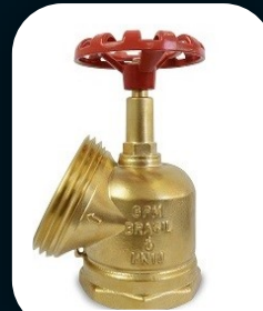
REGISTRO GLOBO PREDIAL PN 10