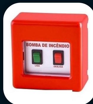
BOTOEIRA DE BOMBA