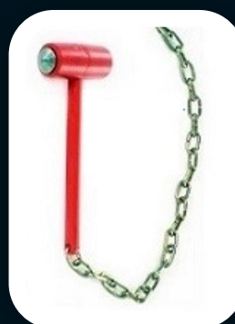
MARTELINHO QUEBRA VIDRO