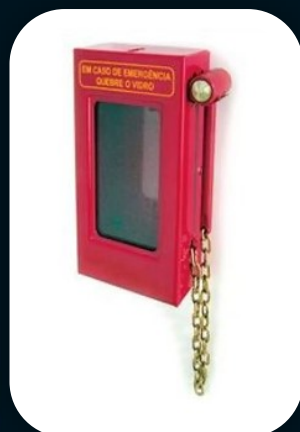
CAIXA PORTA CHAVE COM MARTELINHO