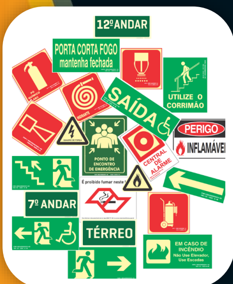
SINALIZAÇÃO DE EMERGÊNCIA Equipamentos - Orientação e Salvamento - Alerta Mensagens - Rota de Fuga