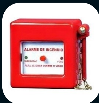
BOTOEIRA DE ALARME