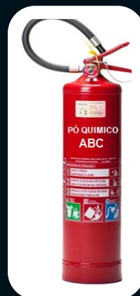
PÓ QUÍMICO ABC 4, 6, 8, 12, 20 E 50 KG