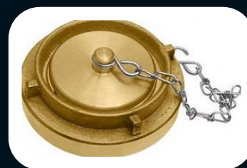
TAMPÃO STORZ COM CORRENTE