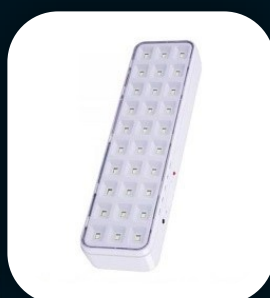
LUMINARIA AUTONOMA LED DE EMERGENÇA