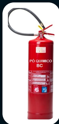
PÓ QUÍMICO BC 4, 6, 8, 12, 20 E 50 KG