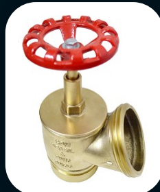
REGISTRO GLOBO INDUSTRIAL PN 16