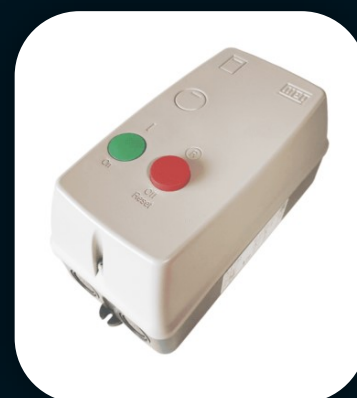
CHAVE MAGNÉTICA 220V 17A TRIFASICO